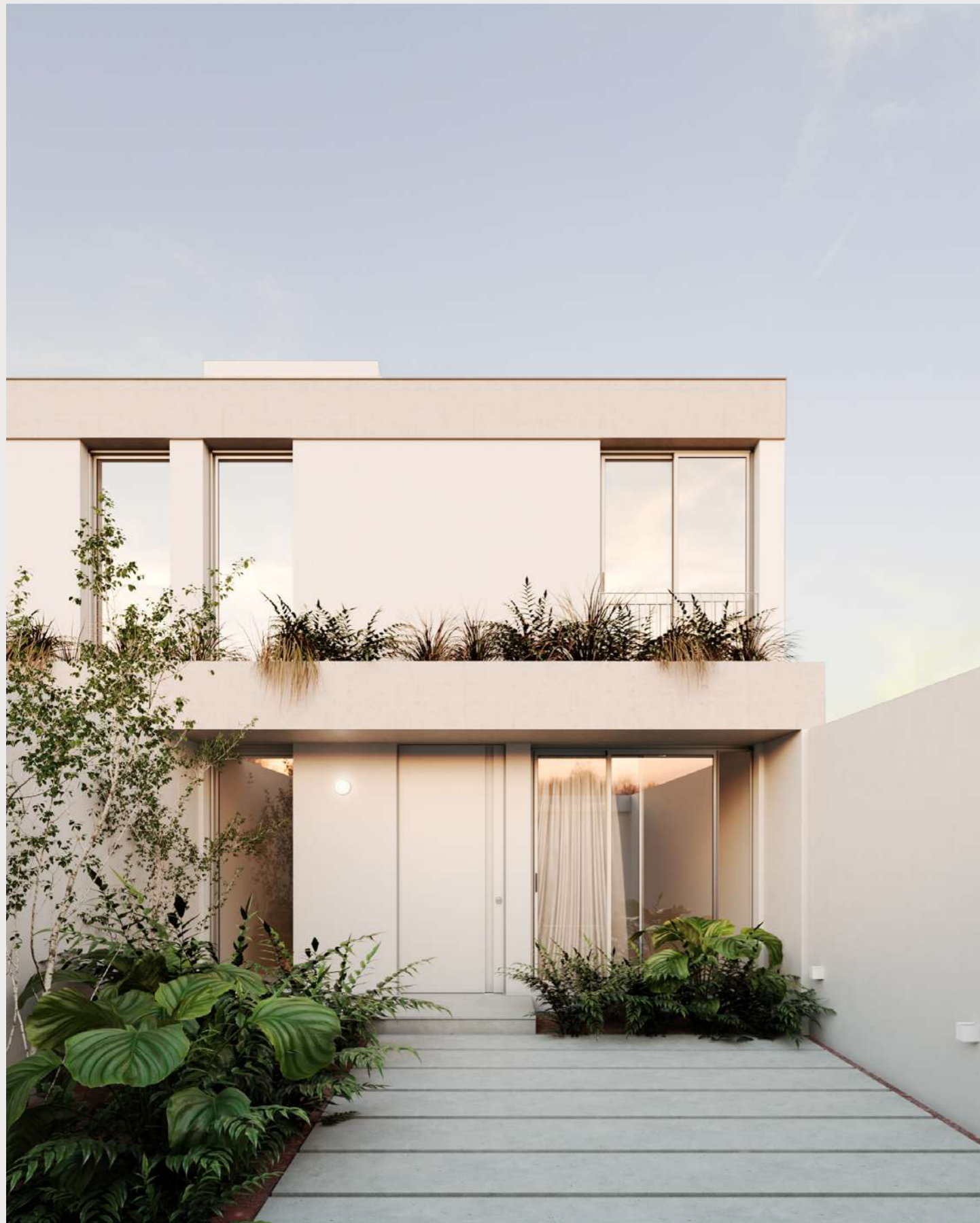
PATIO DE INGRESO CON COCHERA DESCUBIERTA