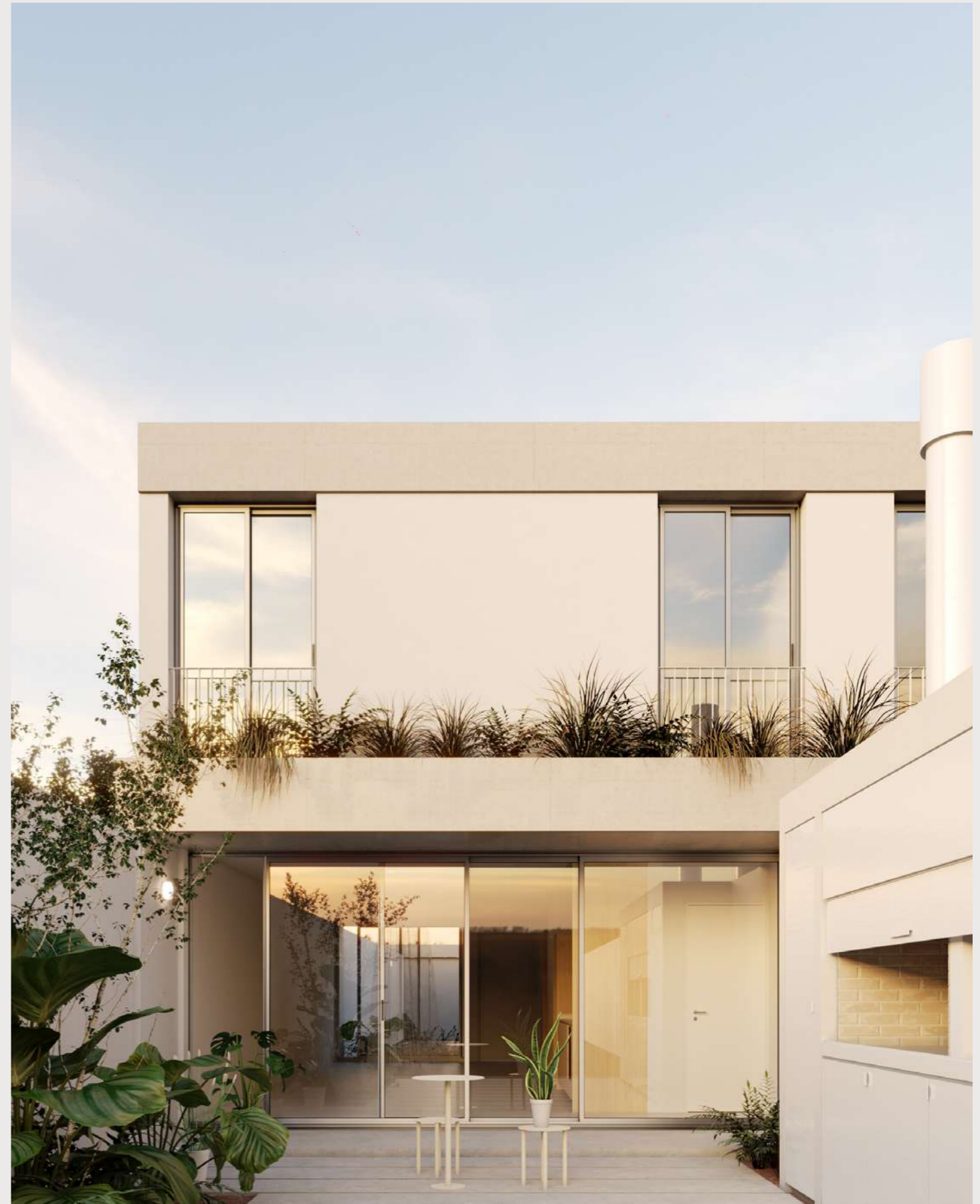
PATIO CON PARRILLA