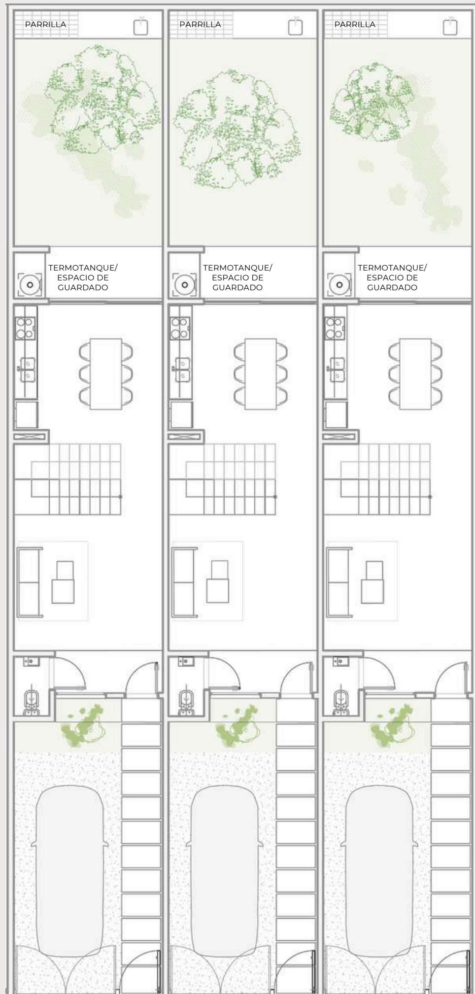
PLANTA BAJA 38 m2 cubiertos