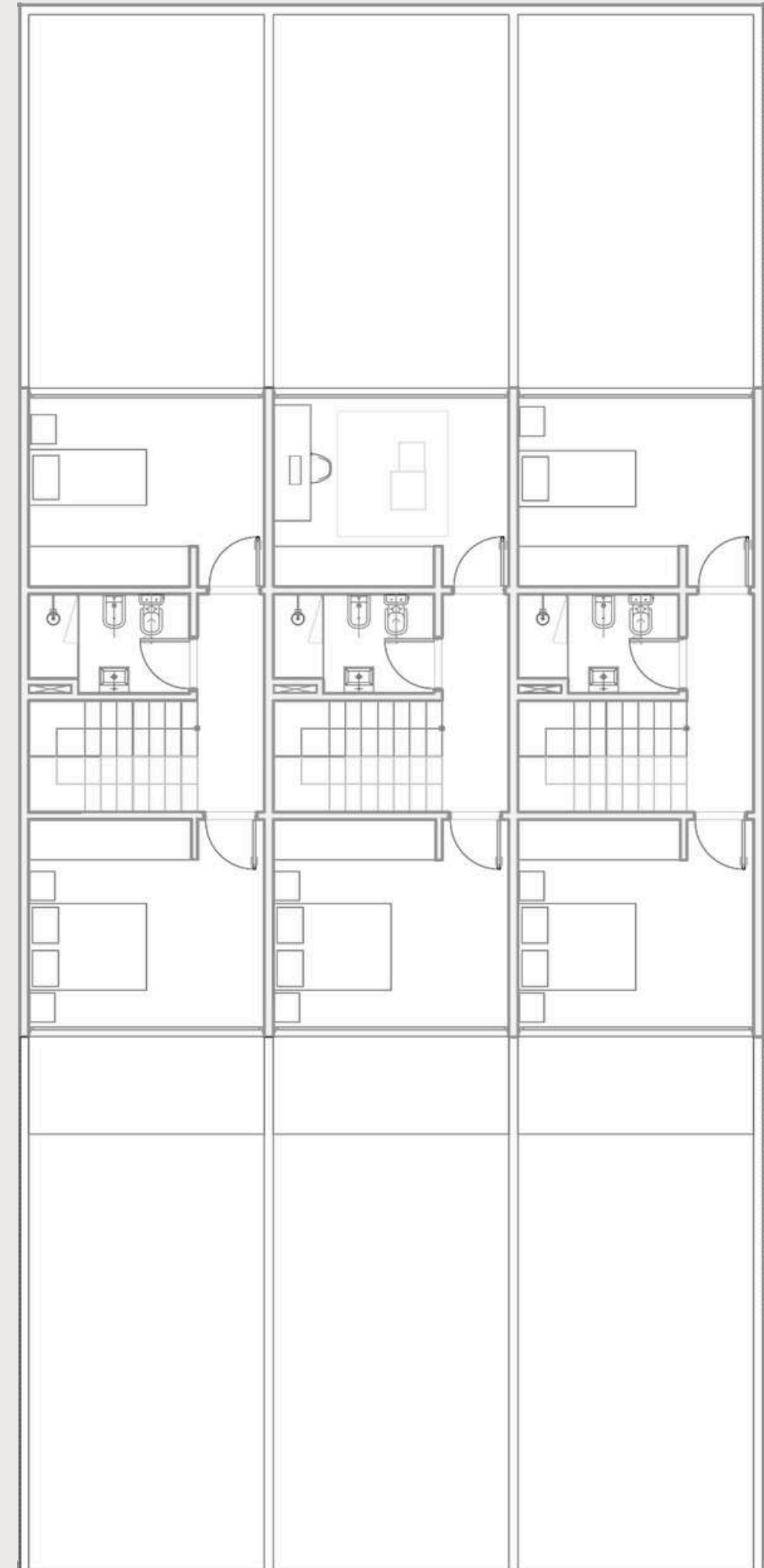
PLANTA ALTA 39 m2 cubiertos